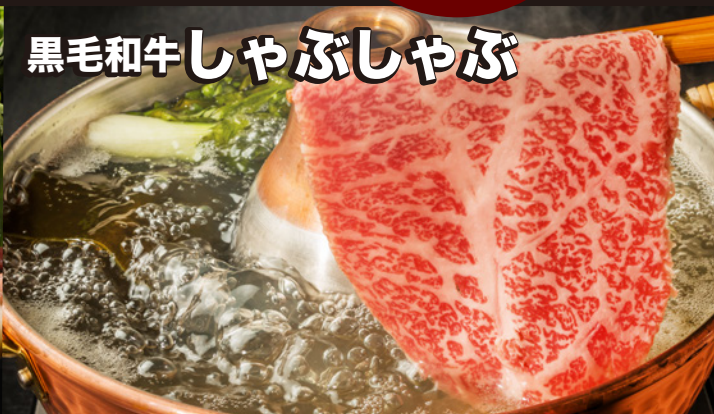
黒毛和牛しゃぶしゃぶ

黒毛和牛すき焼き(ロース) (野菜・ライス付き) 1人前 ¥7,000 (税込)