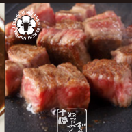
十勝ぬっぷく黒毛和牛 サイコロステーキ