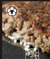
十勝ぬっぷく黒毛和牛 ハンバーグ