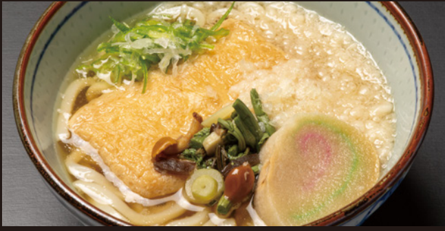
きつねうどん 990円(税込)

道産たまごの卵黄を満月に、卵白を月にかかる雲に見立てて「月見」と呼ばれています。