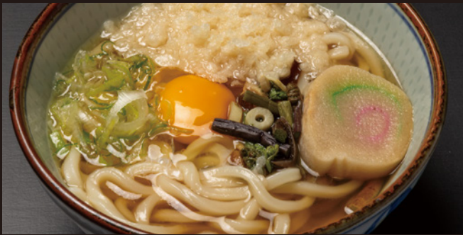
月見うどん 990円(税込)

道産たまごの卵黄を満月に、卵白を月にかかる雲に見立てて「月見」と呼ばれています。