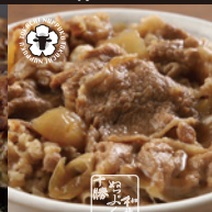
十勝ぬっぷく黒毛和牛 牛 丼