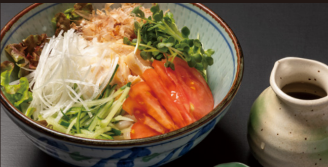
サラダうどん 1,250円(税込)

十勝産の旬の野菜がたっぷりのサラダうどんは いかがでしょうか。冷たいうどんをどうぞ