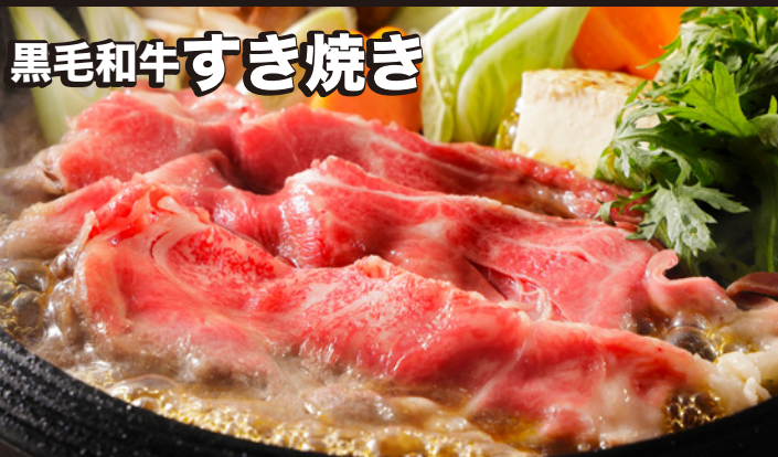
黒毛和牛すき焼き