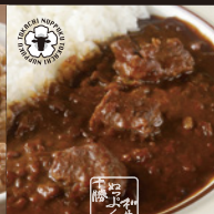
十勝ぬっぷく黒毛和牛 ビーフカレー